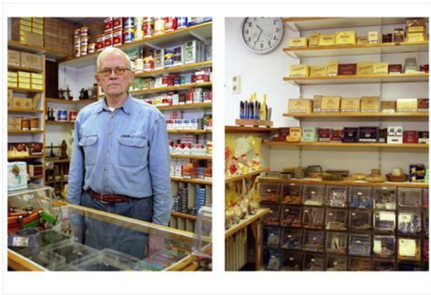
Marlies Swinkels, Hart voor de Zaak VII

Tot slot vormt Hart voor de Zaak van fotografe Marlies Swinkels een serie in de collectie van Business Art Service waarin de liefde voor werk aan alle kanten aanwezig is. De documentaire fotoserie toont in tweeluiken – één portret en één interieurbeeld – ondernemers die al jarenlang met trots en liefde hun eigen zaak runnen en inmiddels (bijna) de pensioenleeftijd hebben behaald. De kunstwerken laten ons weer even stilstaan bij waar we zo'n groot deel van ons leven mee bezig zijn. Om toegewijd te zijn in je werk, iets te doen waar je gelukkig van wordt en waar je graag verantwoording voor draagt. Het stimuleert ons om hier kritisch over te blijven, maar vooral ook om ons werk in al zijn verschillende facetten te blijven waarderen.