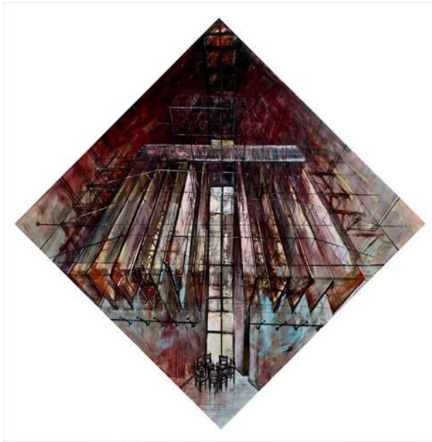
Paulus Kamp, Koffietijd in de kleine zaal

De tweede kunstenaar in de collectie van Business Art Service die kunstwerken maakt over het kantoor- en bedrijfsleven is Paulus Kamp . De ruitvormige schilderijen tonen ons abstracte gebouwen met een nadruk op architectuur. De titels van de werken - 'koffietijd in de kleine zaal', 'tussen twaalf en twee' - brengen de abstracte composities echter verder tot leven. De titels maken van de schilderijen sfeervolle en vooral hele herkenbare taferelen over de werkcultuur, waarin de aanwezigheid van de werknemers bijna voelbaar wordt.